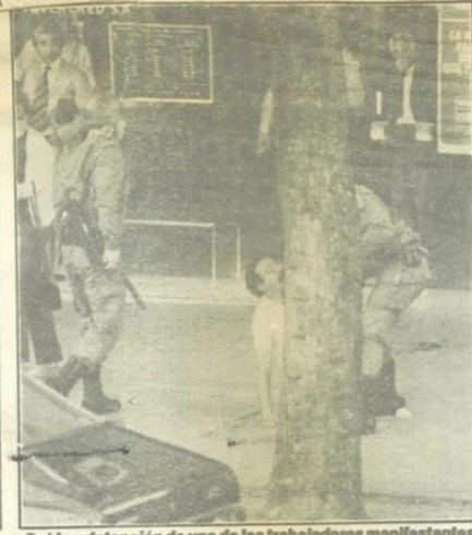
Caida y detención de uno de los trabajadores manifestantes.