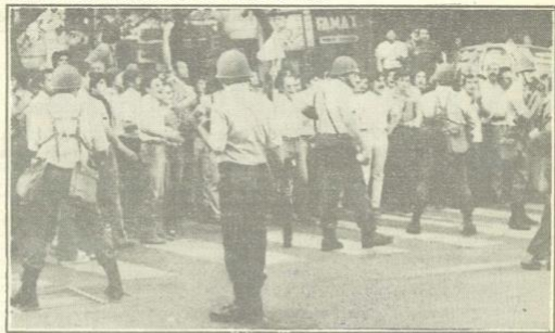
Mendoza: Efectivos policiales proceden a reprimir a manifestantes.

COMISIÓN PROVINCIAL POR LA MEMORIA www.comisionporlamemoria.org