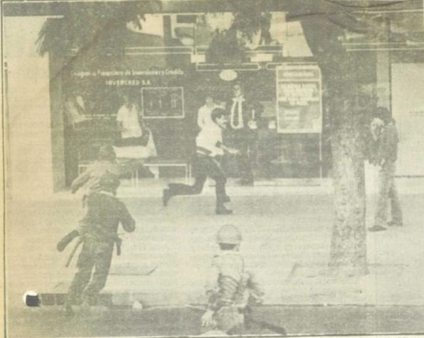
Empiezan corridas e intentos de burlar el cerco que impedía acceso a Plaza de Mayo.