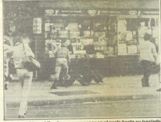
Dos detenidos, obligados a permanecer en el suelo hasta su traslado.