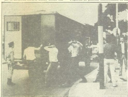
Los carros policiales reciben a obreros apresados durante la marcha.