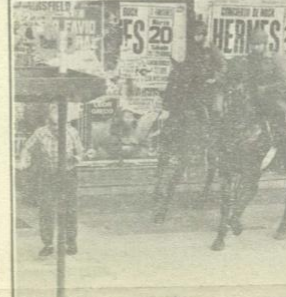
Otro reportero gráfico es zamarreado violentamente durante su trabajo.