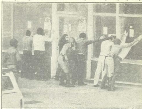
Más detenidos, sometidos a la palpación de armas por la policía.

Piquetes de policías uniformados, en nú-