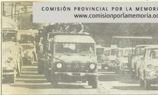
Córdoba: circularon vehículos militares fuertemente pertrechados.