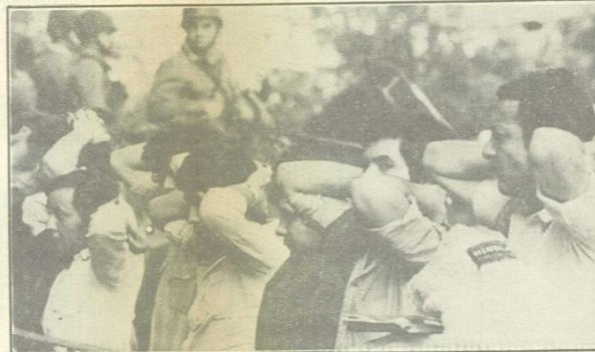
Un grupo de manifestantes, detenido y custodiado por la policía, permanece de pie y con las manos en la nuca, antes de su traslado a una dependencia policial.