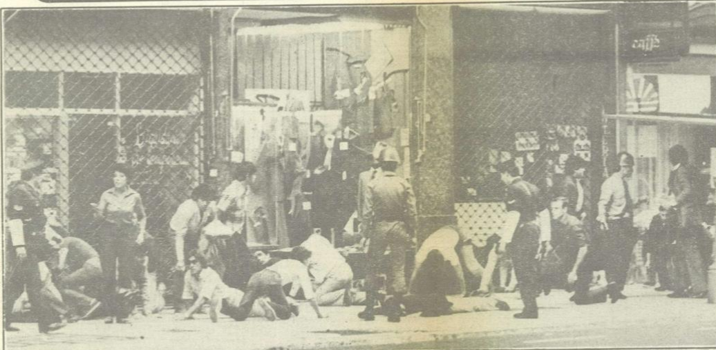
Manifestantes y transeúntes responden a la orden de inmovilización que determina el cuerpo a tierra, rodeados por personal policial. Algunos intentan dar una explicación que no tuvo eco generalmente, dada la tensión con que se vivían esos momentos.