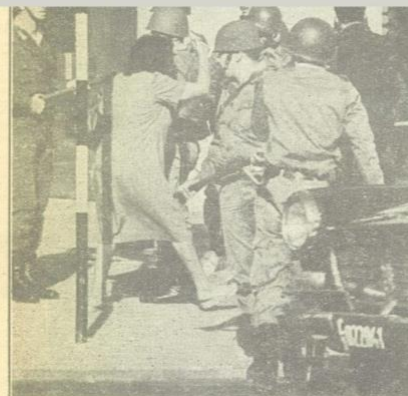
Barreras policiales comienzan a frenar el avance obrero.