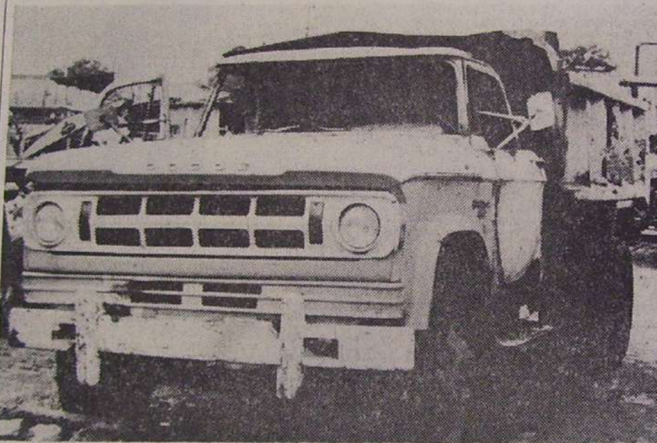
Vehículo municipal inutilizado por una bomba Molotov. Se hallaba estacionado en el corralón comunal de Blas Parera, a la altura de Bv. Pellegrini

Ai promediar la mañana fueron retirados de circulación todos los ómnibus del transporte urbano, incluso los que cubren frecuencias a Santo Tomé y Arroyo Leyes e intermedias.