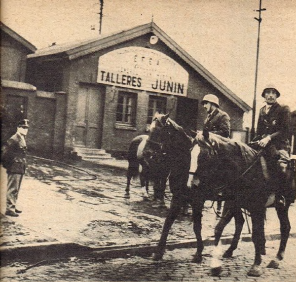
Aunque en general el movimiento huelguista se desarrolló en forma tranquila, hubo incidentes aislados. Los primeros ocurrieron en Junin, centro ferroviario de importancia del sistema del San Martín, cuyos talleres son severamente custodiados por la policía de la provincia de Buenos Aires.