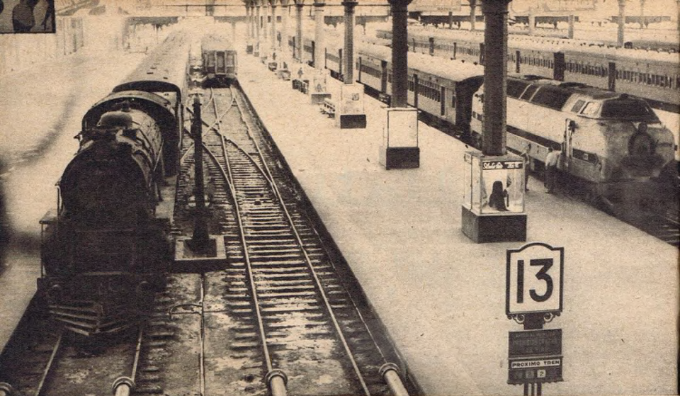
Estaciones silenciosas, convoyes detenidos, locomotoras abandonadas y andenes vacíos caracterizaron el espectáculo de las terminales de Buenos Aires durante la primera semana de huelga, que fue de paralización total. Posteriormente, el gobierno logró organizar servicios de emergencia. Esta resultó ser la más prolongada de las huelgas ferroviarias conocida en el país desde 1912, cuando el gremio pasó 57 días sin concurrir a sus tareas.