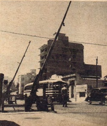
Con las barreras levantadas por ausencia del personal, un tren atraviesa el paso a nivel de la calle Nazca, en la Capital Federal, y las vías del Ferrocarril Sarmiento. Agentes de policía e inspectores de tránsito de la Municipalidad mantienen vigilancia en previsión de accidentes.