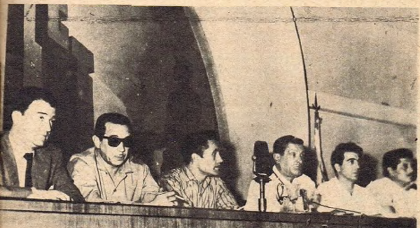
La mesa directiva de la Confederación General del Trabajo que presidió la asamblea que votó por el cese total de actividades laborales por 72 horas en apoyo de los ferroviarios. El conflicto se precipitó por la resolución del gobierno de cerrar ocho talleres ferroviarios.