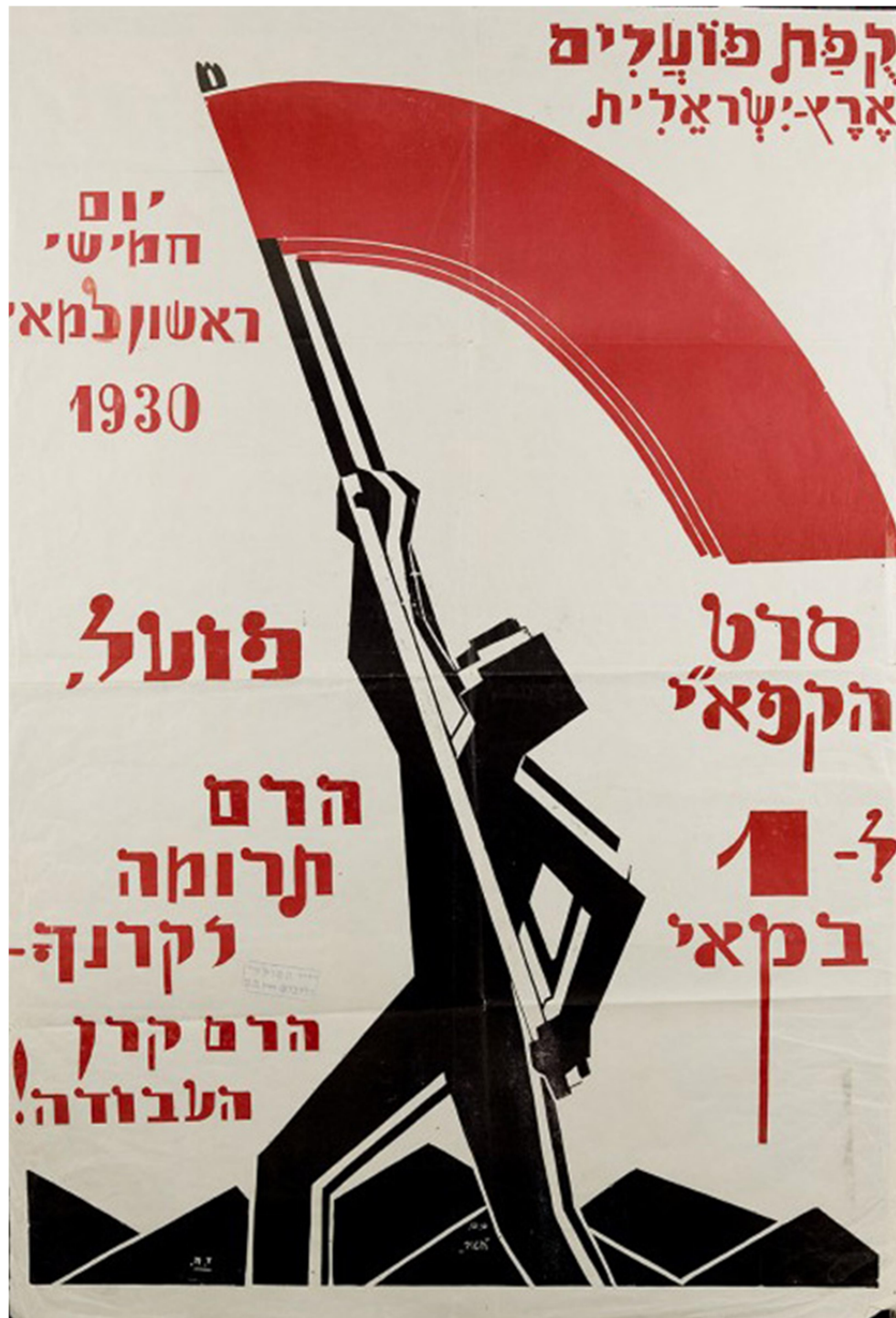
“Elevar la dignidad del Trabajo”, Federación General de Trabajadores de la Tierra de Israel (Histadrut), diseñado por S.T. Hatov, 1930