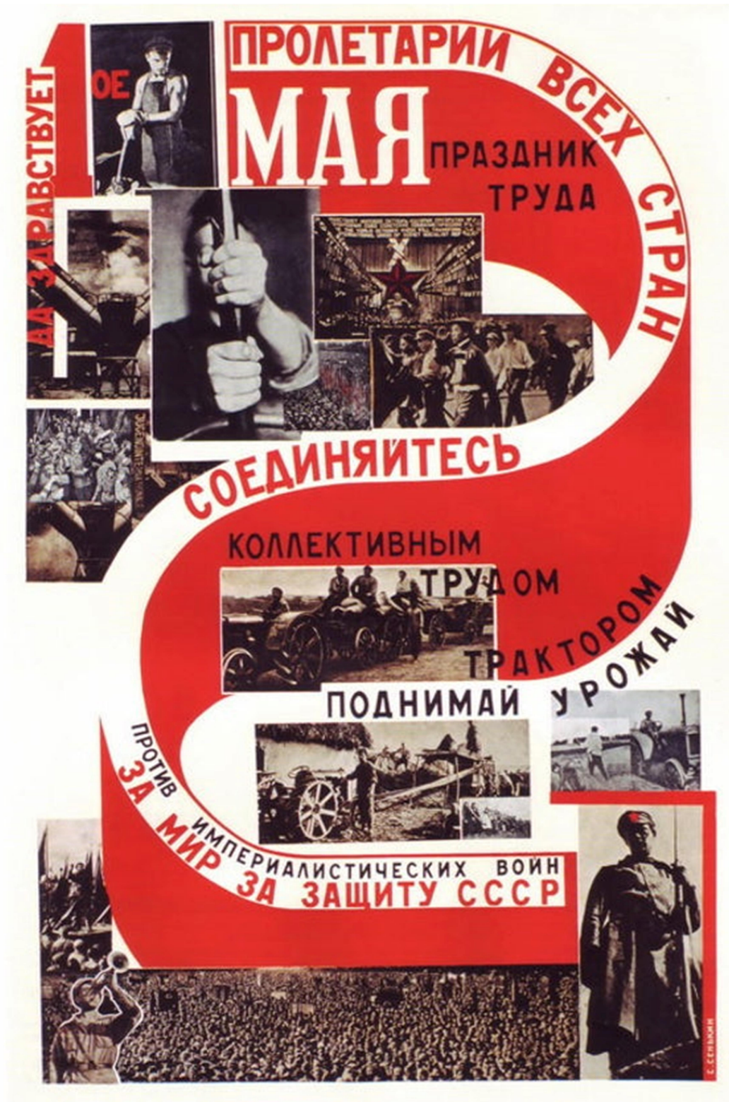
Unión Soviética, 1° de mayo de 1929