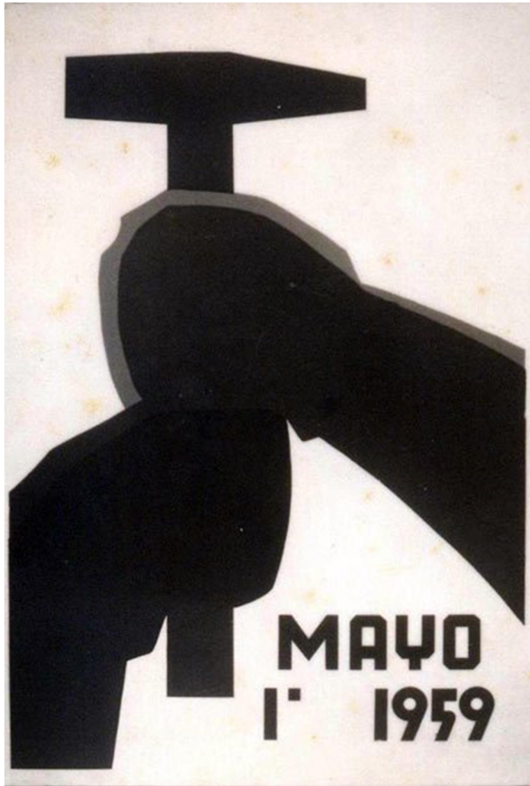
Cuba, 1° de mayo de 1959.