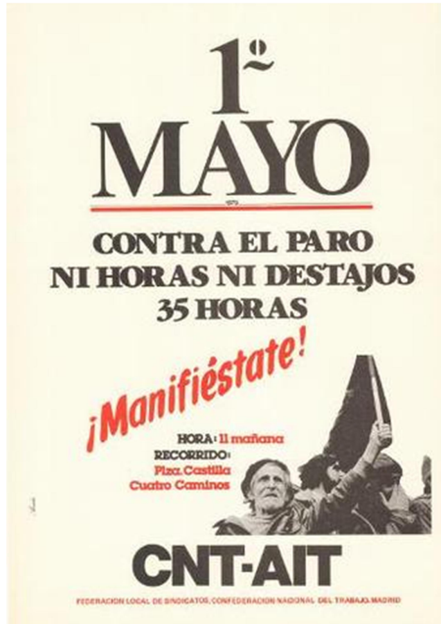
España, 1º de Mayo de 1910 1º de Mayo 1910. CNT-AIT.