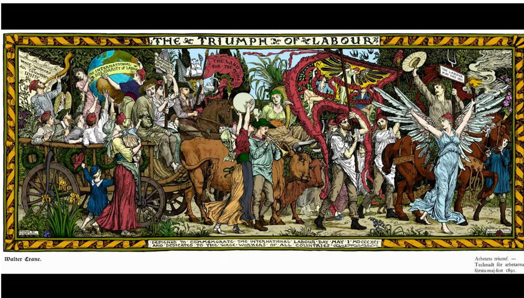
El triunfo del trabajo, 1° de mayo de 1891, Walter Crane