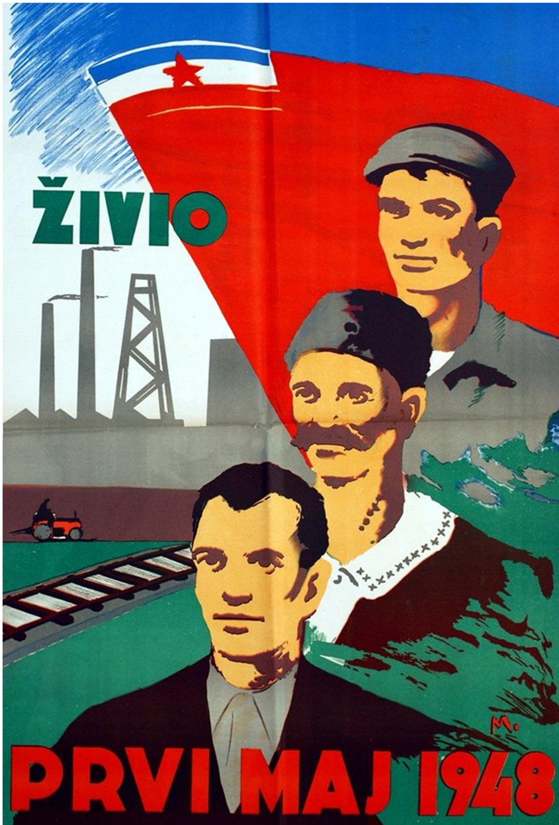
"¡Feliz 1 de mayo! ¡Viva la lucha de la clase obrera!", República Socialista de Bosnia, 1948.