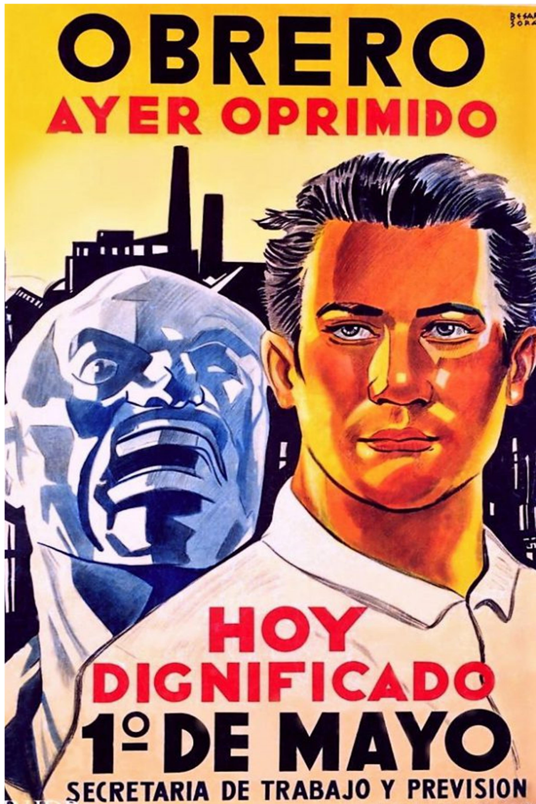
"Obrero, ayer oprimido, hoy dignificado". Afiche de la Subsecretaría de Informaciones para la Secretaría de Trabajo y Previsión, 1949. Autor Gaspar Besares-Soraire.