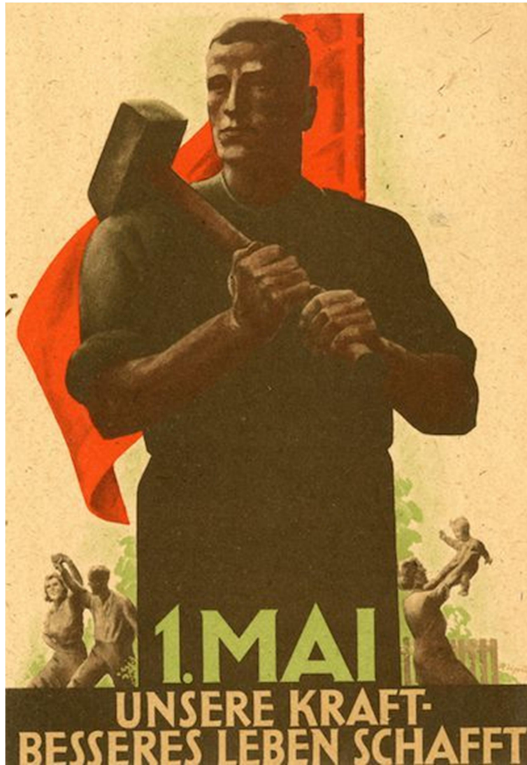
República Democrática de Alemania, 1° de mayo de 1947