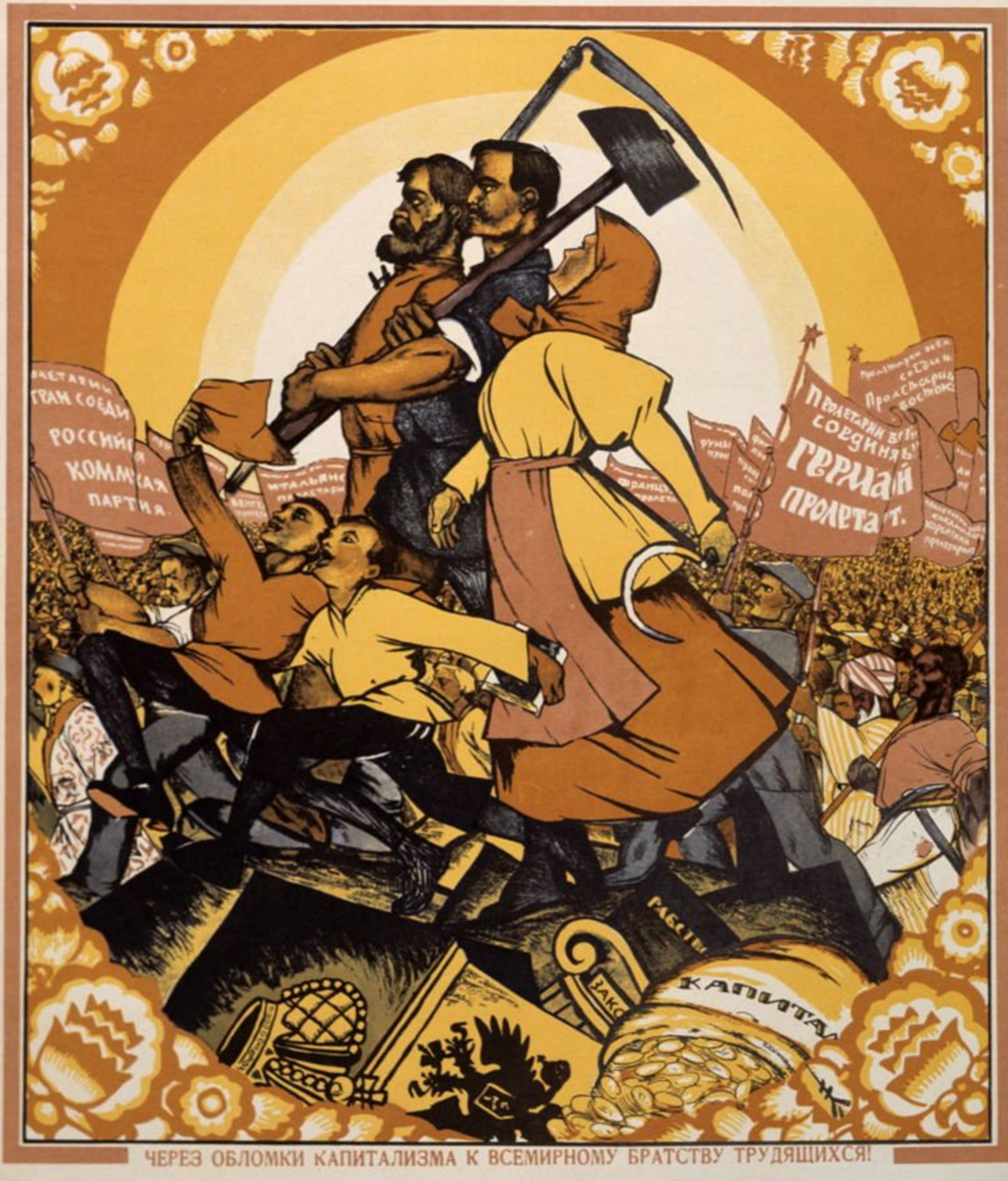
"Sobre las ruinas del capitalismo, la hermandad de campesinos y trabajadores marcha contra los pueblos del mundo", diseñado por Nicolas Kotcherguine para el 1 de mayo de 1920