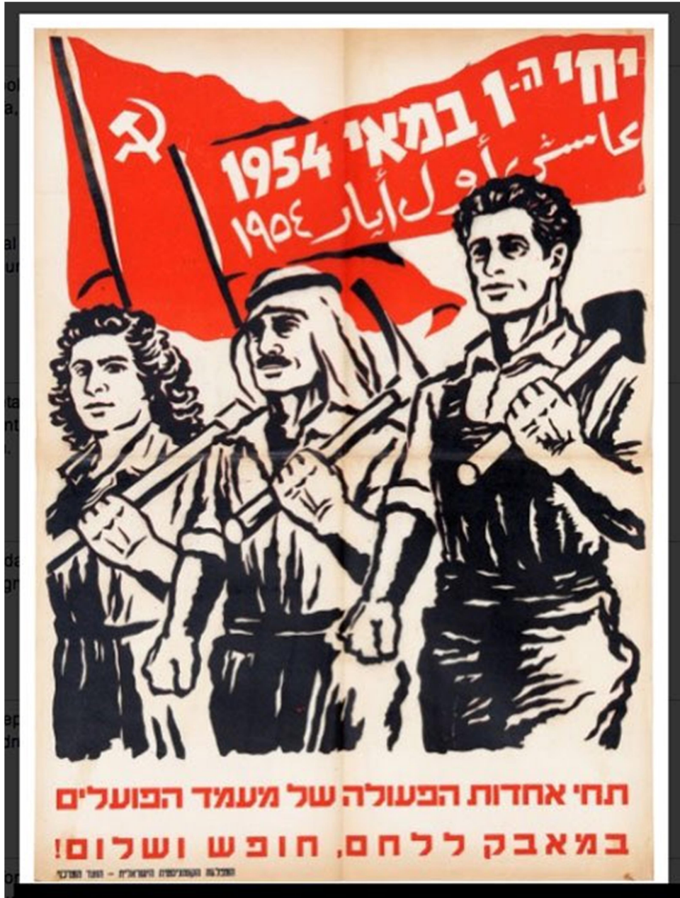
"1° de mayo". Partido Comunista israelí, 1954.