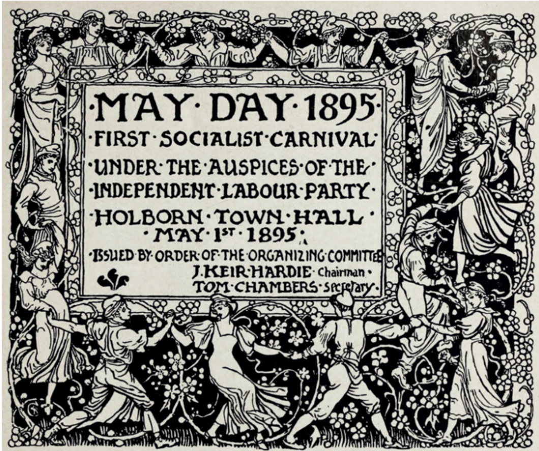
Walter Crane, 1° de Mayo de 1895