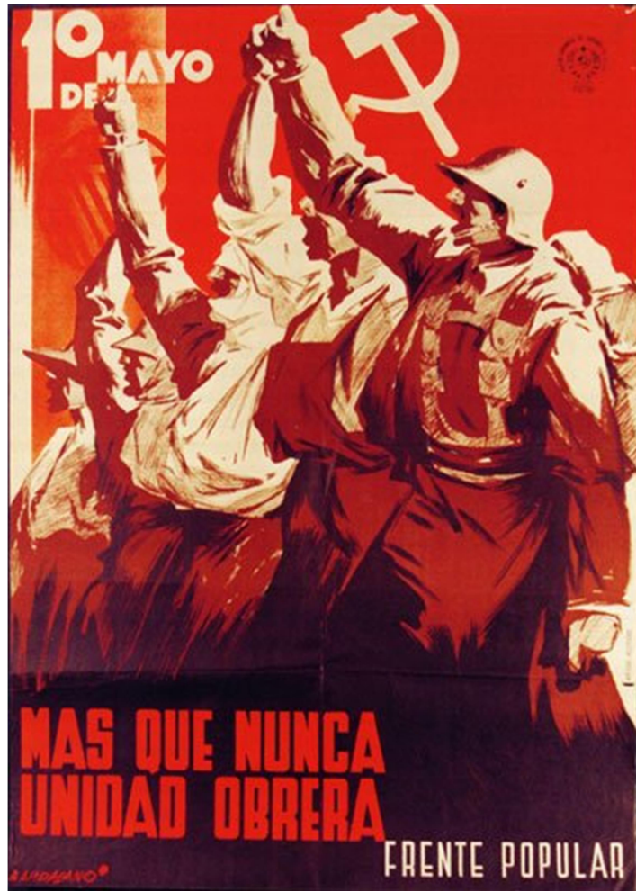
España, 1° de mayo de 1937.