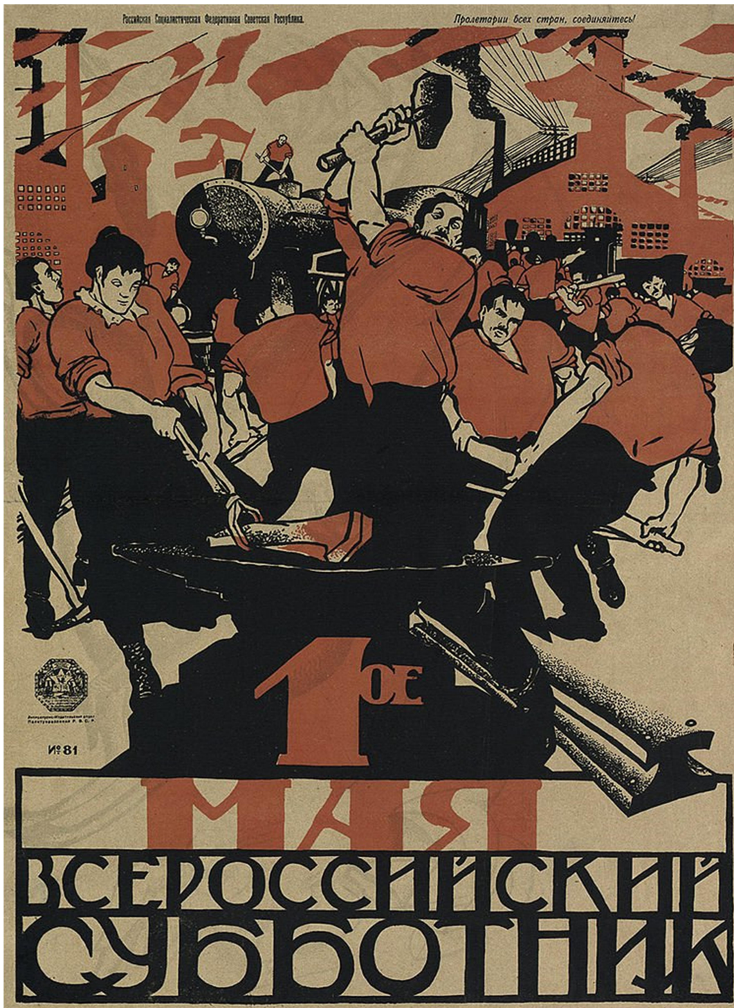
Póster de Dmitri Stachievich Moor (1883-1946), 1 de mayo de 1920, Rusia.