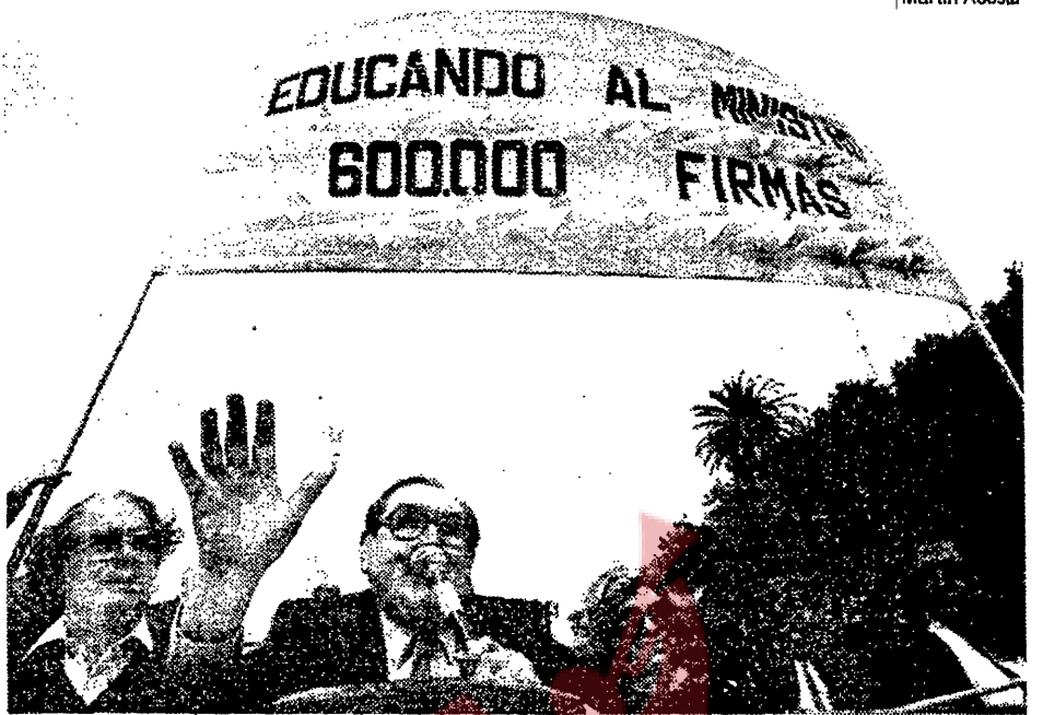
La clase pública en Plaza de Mayo: los investigadores quieren educar al ministro Cavallo acerca del valor que tiene la ciencia.

por un rato en "alumnos" estaban los actores Leonor Manso y Cacho Espíndola, los concejales Aníbal Ibarra y Eduardo Jozami, la diputada Graciela Fernández Meijide, el senador José Bordón y el frentista Carlos "Chacho" Alvarez.